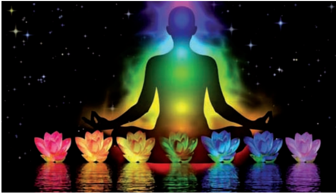
Vollmondmeditation im Zeichen Skorpion

Das Ich muss auf jegliche Fremdbesetzung verzichten, leer werden und Raum schaffen, damit das Selbst die Führung übernehmen kann.