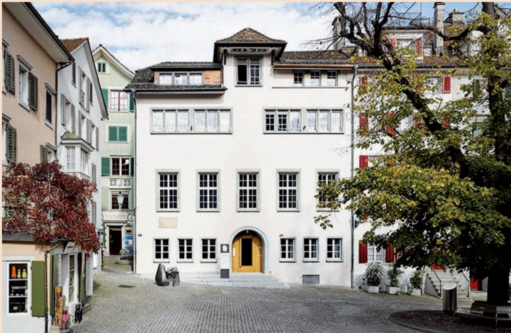
Bild: Lavater-Haus in Zürich