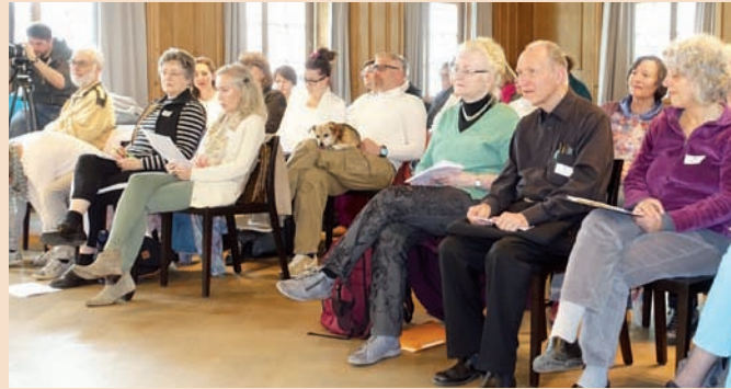
Tierische Entspannung beim Nachmittagsprogramm