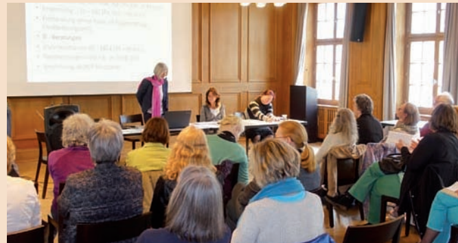
Zahlreiche Wortmeldungen zu den Anträgen