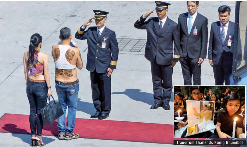
Bild: Begrüßung Thailands Thronfolger auf dem Rollfeld Trauer um Thailands König Bhumibol

Freude herrscht nach längerer Arbeitslosigkeit – Thailands Thronfolger erhält nun Job als König!