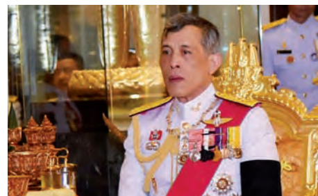
König Maha Vajiralongkorn

löst ist und nur mit einem einseitigen Sextil mit Saturn verbunden ist. Das bedeutet, dass das Sonnenbewusstsein Mühe bekundet alle Teile der Persönlichkeit zu einer funktionellen Einheit zu verbinden und alle Kräfte gemeinsam auf ein Ziel zu lenken. In der Transformation der Sonne, schreibt Louise Huber, sehen wir einen Menschen, der sich für höhere Ziele einsetzen will und bereit ist, sich von allen hinderlichen Faktoren der «kleinen Persönlichkeit» zu befreien. Ein Mensch mit einer transformierten Sonne strahlt die Kraft und Weisheit einer starken und integren Persönlichkeit aus und ist ein Vorbild für viele.